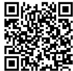
QR-Code zum Download der APP