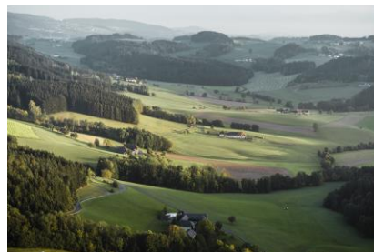
Mühlviertel Granitlandschaft