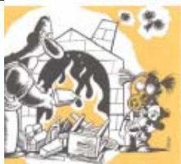
Illustration: Ernst Feurer-Mettler (Basel/CH)

Verboten ist das Verbrennen von beschichtetem Restholz aus holzverarbeitenden Betrieben und von Baustellen (bemaltes, lackiertes, verleimtes und gegen Schädlinge behandeltes Holz) oder Holzwerkstoffen (z.B. Spanplatten) und Altholz von Möbeln, Fenstern, Türen, Läden, Böden und Balken. Und natürlich: Abfälle aller Art , z. B. Plastiksäcke, Milchpackungen, Kaffeeverpackungen, Joghurtbecher, Putzlappen und Biomüll dürfen nicht im eigenen Ofen landen.